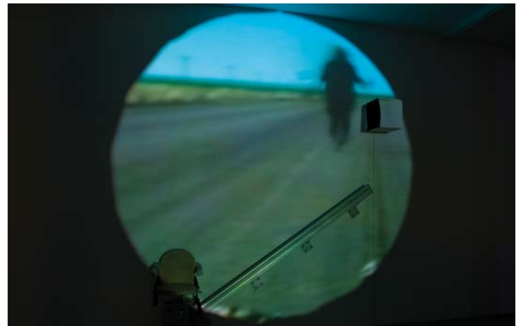
FBM-Studio, Zürich, Installationsansicht, „Christoph Schlingensiefel: Querverstümmelung“, migros, museum für gegenwartskunst, Zürich

Total irritation as a means of liberation, of attaining a new form of concentration, demands actively participating viewers with the ability to take decisions. The principle of combating illusion is demonstrated especially by Schlingensiefel's work for the theatre, in his inter-media worlds in which residues of the Wagnerian notion of the Gesamtkunstwerk hook up with Artaud's Theatre of Cruelty as well as the post-modernist abject. The installation „The African Twintowers – Stairlift to Heaven“ literally puts the audience in the picture: cutting through the projected film, one viewer at a time ascends two metres by stairlift in order to pull back a curtain revealing a box in which a second short film is on private view. Shot in Lüderitz, Namibia, the main film deals with the events of 9-11 and draws on Norse sagas and African shamanism. It includes figures like Hagen von Tronje, Odin and Edda, members of the people of the Hereros, an African herding people, and ghosts – as well as music by Patti Smith with texts by Elfriede Jelinek.