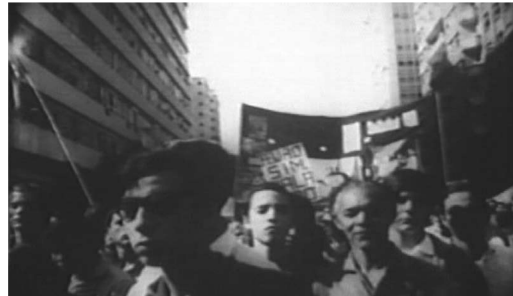
1968 (1968) von Glauber Rocha, Filmstill