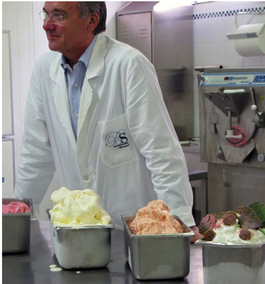
Art Flavours von Tim Etchells

„Kings, Lords, liars, usherettes, goal-hangers, gun-men and prostitutes, Whether or not these stories bear any relation to life as it is lived in Endland (sic) is not my problem and good riddance to all those what prefer to read abt truly good, lucky and nice people—you won't like this crap at all. Bear in mind it is not a book for idiots or time-wasters but many of them are wrote about in it. For the rest—concerning the bad language, bad luck and low habits of the persons described—I make no apologies and, like the poets say, „welcome to Endland“ ©, all dates are approximate. They replaced the lens in one (1) eye and I am waiting for them to do a operation on the other. Everything is fine. I am not an invalid. Pax Americana, Death to unbelievers, Ringo the Anonymous 1999.“