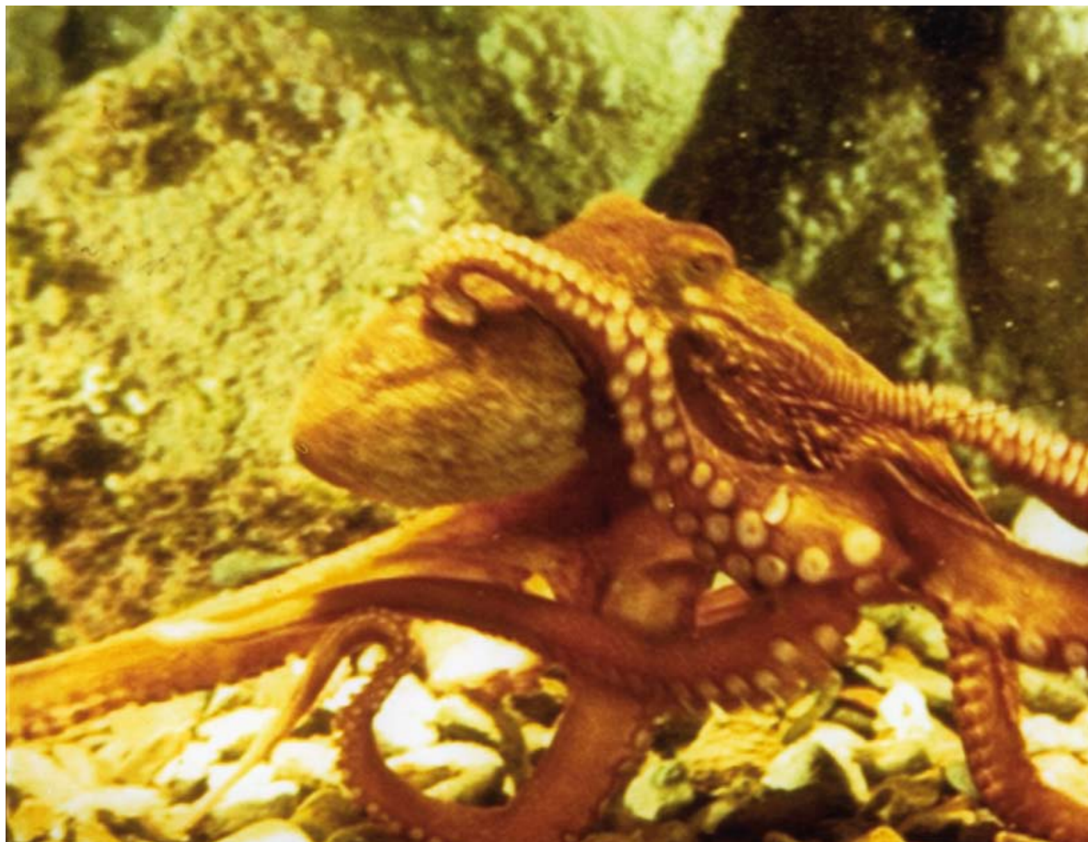
Les amours de la Pieuvre (1965) von Jean Painlevé