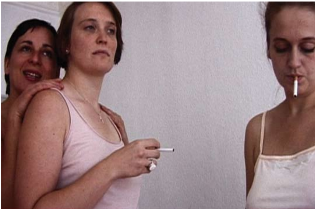
Der Spiegel (2007) von Keren Cytter, Filmstill

GUILTHOUSE; OR THE GREAT FALL OF THE CARTIER FAMILY (2008) INSTALLATION VON KEREN CYTTER UND SUSANNE SACHSSE SET: SENOL SENTUERK SOUND: TIM UND JOHN BLUE 01. – 16. NOV / HAU 3