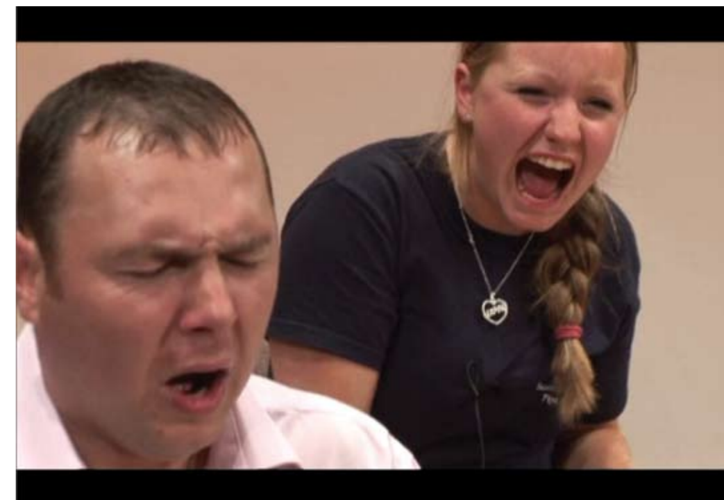
he who laughs last laughs longest (2006) von Phil Collins, Filmstill

„Das Lachen reicht von einer spontanen Reaktion der Fröhlichkeit – oftmals der eines Zuschauers im Angesicht eines Darstellers – bis zu einer gewissermaßen kalkulierten und instrumentalisierten Aktion, einem sportlichen Wettkampf, dessen Teilnehmer einen dicken Batzen Geld vor Augen haben. Die manische Intensität der Wettstreiter beim Lachen, oftmals festgehalten in brutalen Close-ups, verwandelt einen ursprünglichen Ausdruck der Freude in etwas Schwachsinnes und Krankhaftes. Hier bricht die Kommunikation zusammen; die Wettkämpfer sind auf sich allein gestellt und müssen selbst entscheiden, wie viel sie gewillt sind, ihren Lungen, ihrem Kehlkopf und ihren Gesichtsmuskeln für Geld zuzumuten (während der Künstler selbst natürlich der Erfinder und Regisseur derartiger Erniedrigung bleibt). Mir fällt hier unweigerlich ein Zwischentitel aus King Vidors Film ‚The Crowd‘ von 1928 ein: ‚Die Menge wird immer mit dir lachen, mit dir weinen aber wird sie nur einen Tag.‘ Die hohle, von Schmerzen erfüllte Kakophonie des Gelächters von Collins' Teilnehmern wird zu einer Arena der Entfremdung,