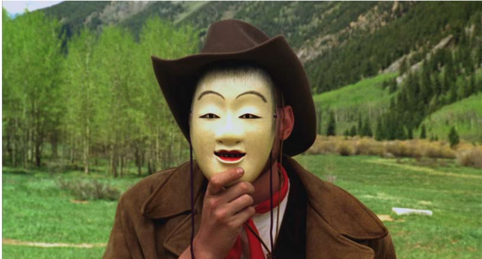
Javier Tellez, “Oedipus Marshal”, 2007, DVD, color/sound, 30 min., courtesy of the artist and Figge von Rosen Galerie Köln.

The program “Mimetism I&II” is based on the exhibition Mimétisme , developed and staged at the Extra City Center for Contemporary Art, Antwerp, Belgium, January – April 2008, curated by Anselm Franke