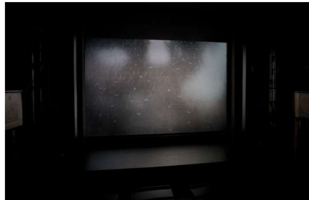
Rain / Regen, 2008, 35mm Film, Loop, 4 Min., Dolby SR, © Thomas Demand, VG Bild-Kunst, Bonn

Many projects by Tim Etchells, well-known in the theatrical context as the creative mind behind the Live Art group Forced Entertainment, centre on his interest in the creative possibilities and limitations of linguistic structures, cultural codes, systems and rules, all of which he regards both as objects of inquiry and functional methods. "Art Flavours" (2008), a project devised for the Manifesta 7 biennial, involves the creation of four new ice-cream flavours inspired by the concepts and conditions of contemporary art. In the course of a series of meetings the artist held with a local ice-cream manufacturer and a writer on art, the work becomes an encounter between the popular frozen sweet and artistic practice, playing with the possibility of translating into new flavours idioms and ideas associated with the specialised art context. HAU 1 now offers a further opportunity to experience these new trends of taste.