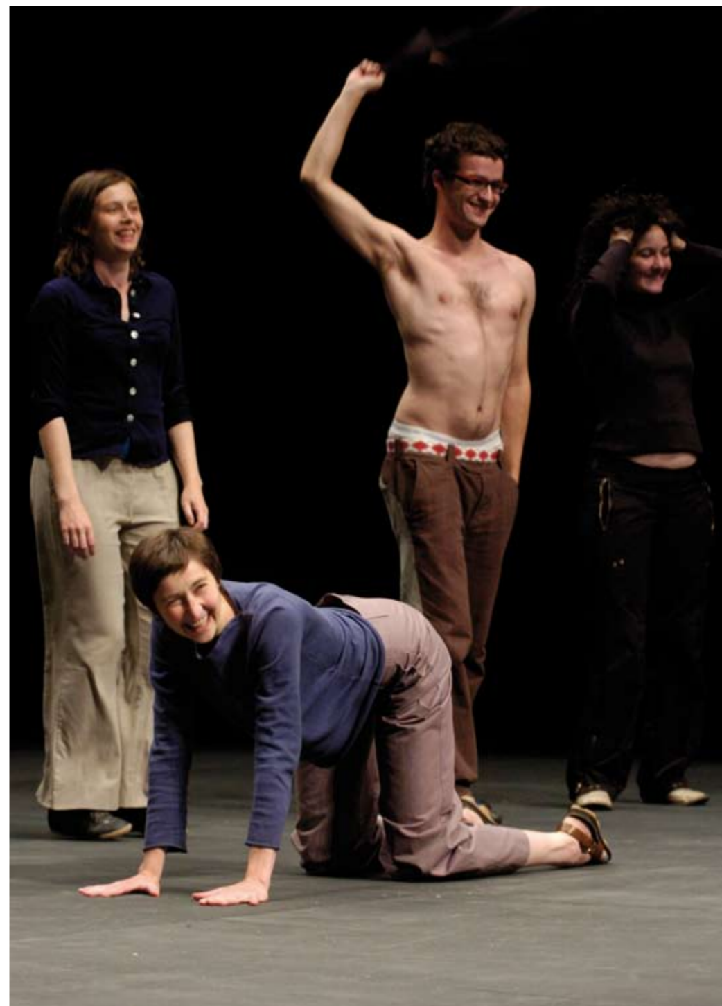
The show must go on (2001) von Jérôme Bel, Foto: Mussacchio Laniello

„Die Möglichkeiten eines Kunstwerks, selbst einer Choreografie, liegen heute nicht darin, eine Form der Äußerung zu zeigen, sondern den Betrachter einzuladen, sich neu zu erfinden oder, etwas weniger utopisch, seine Ideologie des Betrachtens, der Selbst-Bildung oder der Artikulation von Sicherheit neu zu finden. Das Kunstwerk an sich kann nichts sagen, es kann eine politische Idee oder ein Konzept repräsentieren, aber das Kunstwerk ist heute eine Formulierung seiner selbst. Es kann lediglich seine eigene Sphäre untersuchen oder neu suchen, durch Reflexion selbstbewusst werden (per speculum in aenigmae) und über dieses Bewusstsein kann es eine Erfahrung des Selbst (des Betrachters) werden, aber niemals die Erfahrung von etwas anderem. Teil einer Kunsterfahrung zu sein, ist immer nur die Erfahrung des Selbst.“ (Mårten Spångberg)