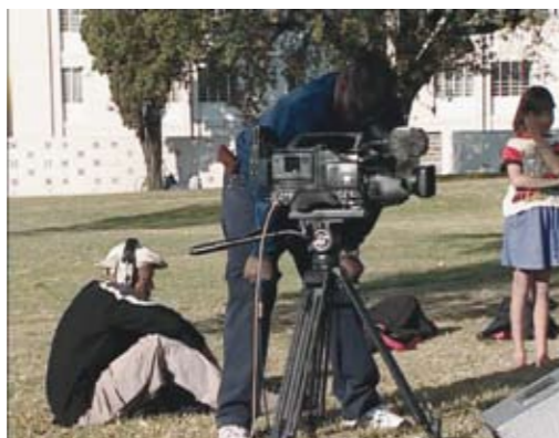
King Kong (2001) von Peter Friedl, Filmstill

„King Kong“ (2001) wurde in Sophiatown (Johannesburg) mit dem Songwriter Daniel Johnston gedreht. Der Film ist die subtile Dekonstruktion eines Video-clips an einem für die südafrikanische Geschichte wichtigen Ort. In Peter Friedls Arbeit geht es um die Reibung von ästhetischem und politischem Bewusstsein vor dem Hintergrund ihrer historisch bedingten Erzählungen und Genres. Seine Arbeit wurde unter anderem auf der documenta X (1997) und documenta 12 (2007), auf den Biennalen in Venedig, Berlin, Sevilla, Gwangju, São Paulo und der Manifesta 7