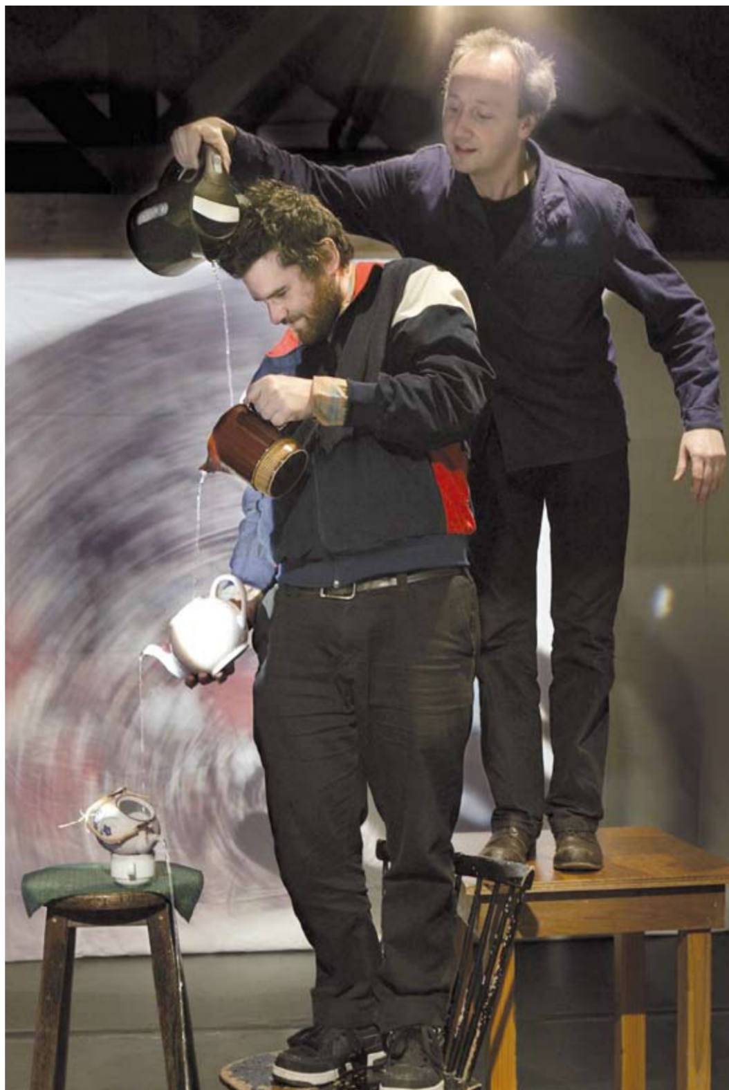
An Anthology of Optimism