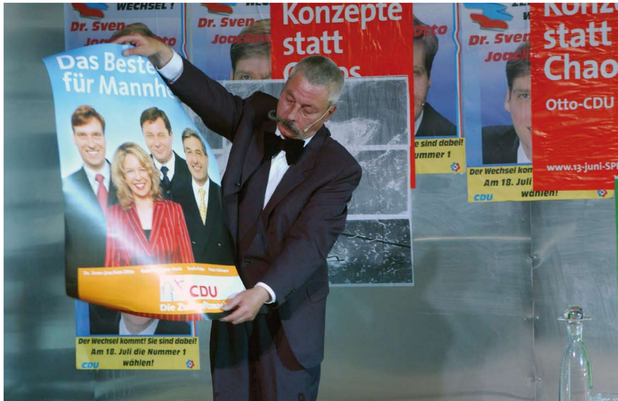
Wallenstein - eine dokumentarische Inszenierung von RIMINI PROTOKOLL